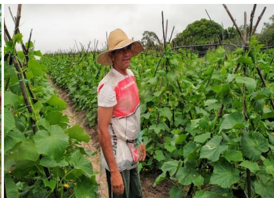
Cultura de Pepino