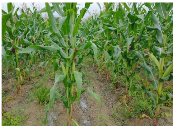
Cultura do Milho