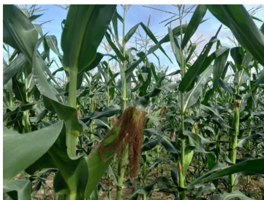
Cultura do Milho