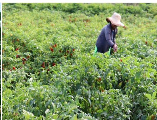
Cultura da Pimenta