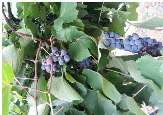
Cultura da Uva