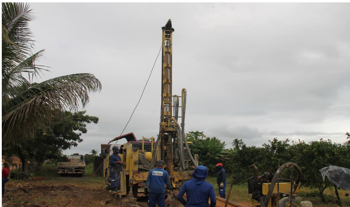
PERFURAÇÃO DE POÇO EM RIACHAO DO DANTAS

No exercício de 2022 a atividade Abastecimento D'Água realizou a perfuração 58 poços tubulares com instalação do sistema de abastecimento de água, beneficiando aproximadamente 22.135 pessoas.