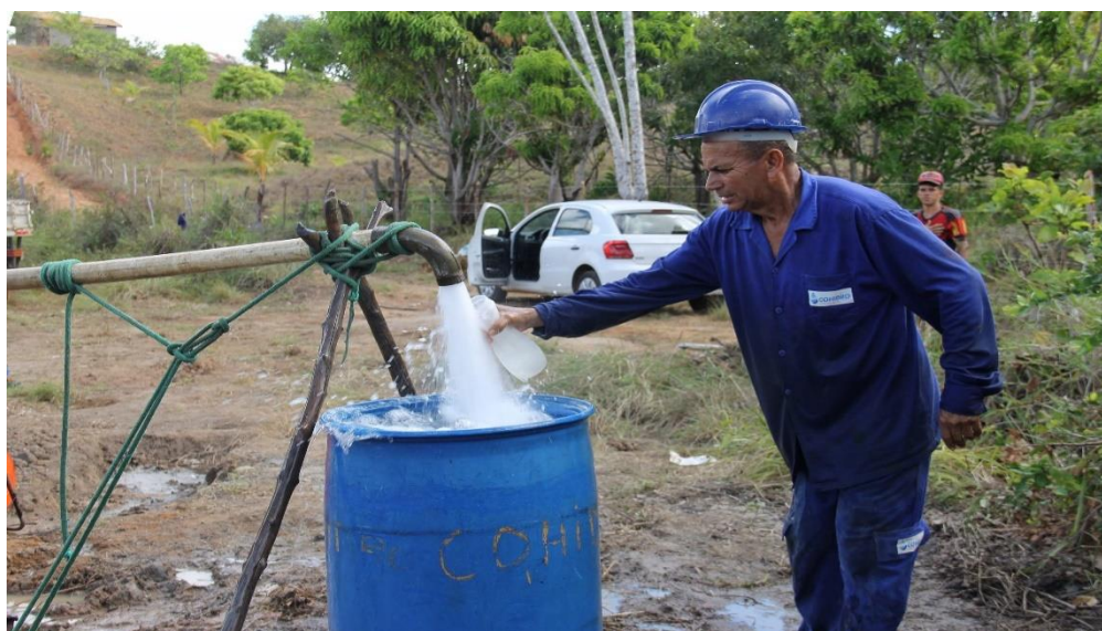
Instalação de Sistema Simplificado de Abastecimento de Água