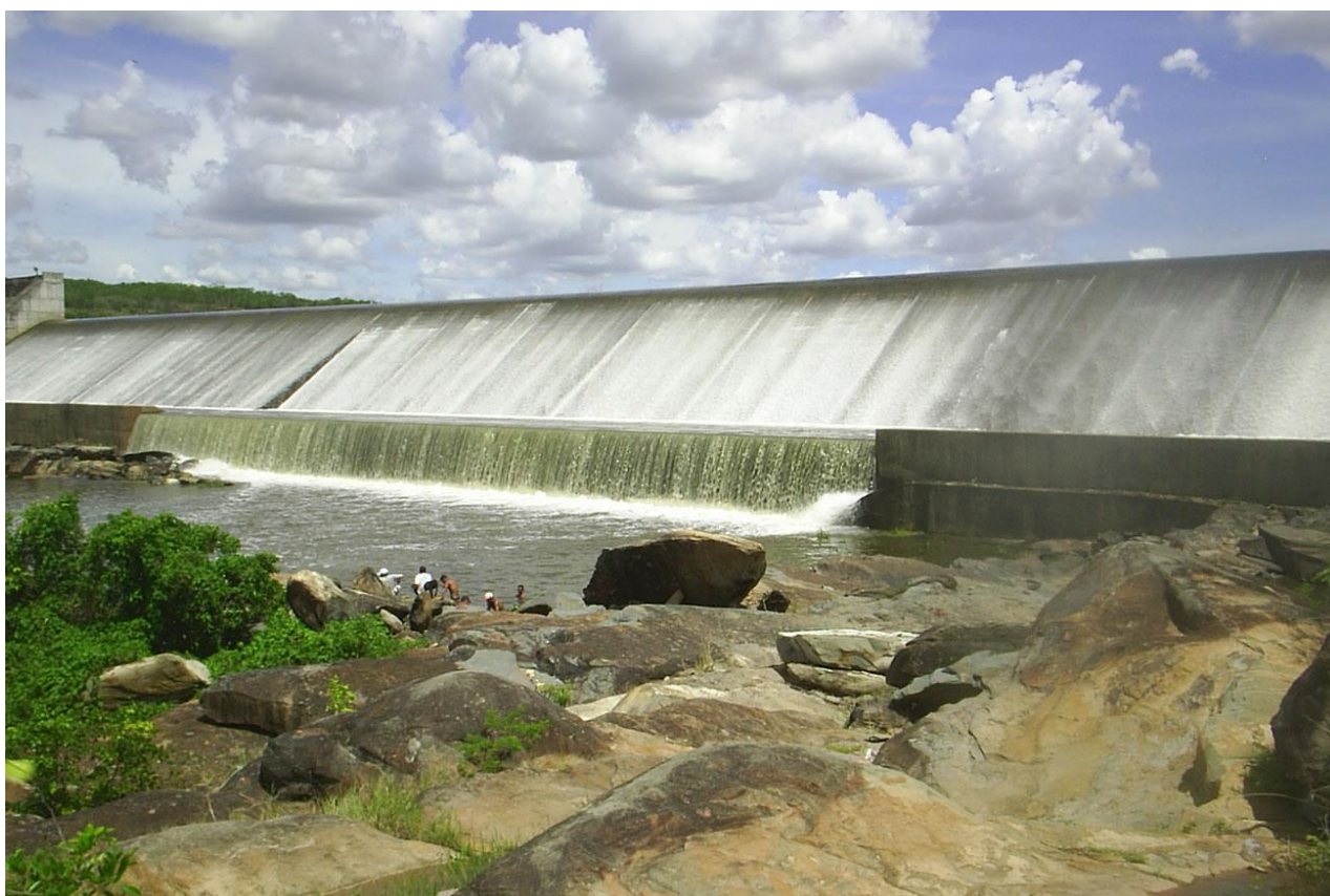
Barragem Perímetro Irrigado Piauí