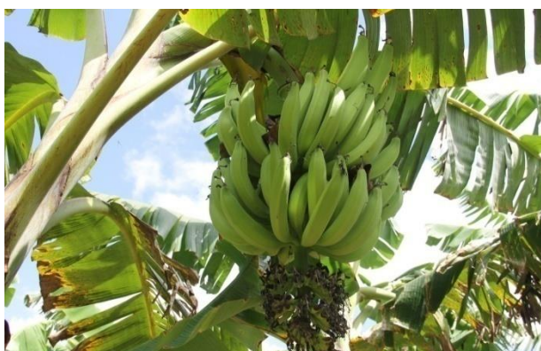
Cultura da Banana