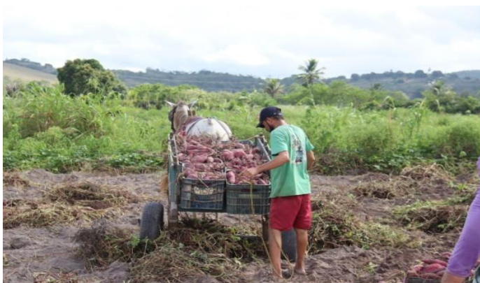
Cultura e Colheita da Batata Doce