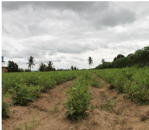
Produção de Abobora e Amendoim no Perímetro Irrigado de Piauí em Lagarto