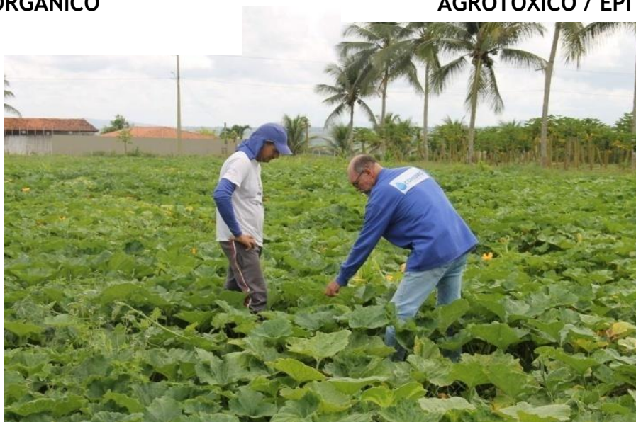
ASSISTÊNCIA TÉCNICA NO PERÍMETRO IRRIGADO PIAUI EM LAGARTO