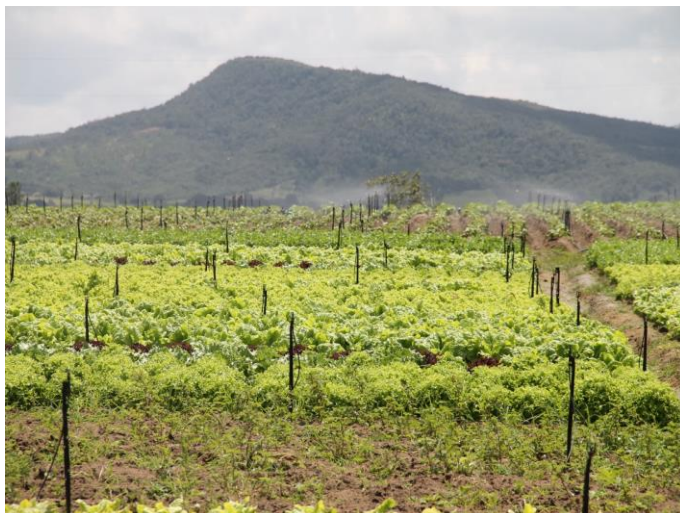
Cultivo de Hortaliças no Perímetro Irrigado Jacarecica I em Itabaiana