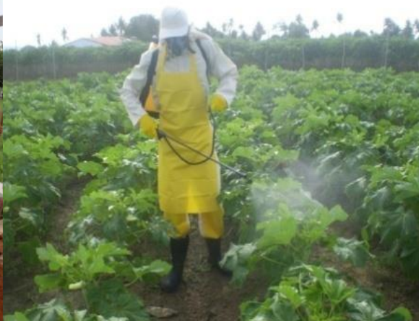
APLICAÇÃO CORRETA DE AGROTÓXICO / EPI