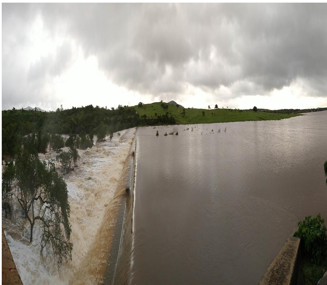
Barragem Perímetro Irrigado Piauí em Lagarto