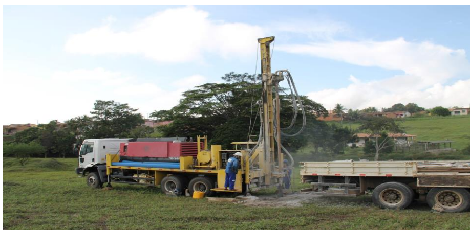
Perfuração de Poço Profundo no Povoado Palmeiras em Malhador

Outro aspecto que merece registro diz respeito ao acervo de conhecimentos, técnicos e equipamentos, atendendo as exigências das ações nas áreas de abastecimento d'água, durante o ano 2019 foram executados: perfuração de 55 poços tubulares em diversos municípios beneficiando cerca de 7.797 pessoas, 30 limpeza e/ou teste de vazão, beneficiando 4.822 pessoas, 30 instalações de poços tubulares, com casa de bombas, adutoras e reservatórios (chafariz), beneficiando 5.160 pessoas, 24 recuperações de poços beneficiando aproximadamente 9.610 pessoas, 118 manutenção de poços beneficiando 23.065 pessoas, todas essas atividades beneficia um total de 50.454 pessoas, conforme discriminação nas tabelas abaixo: