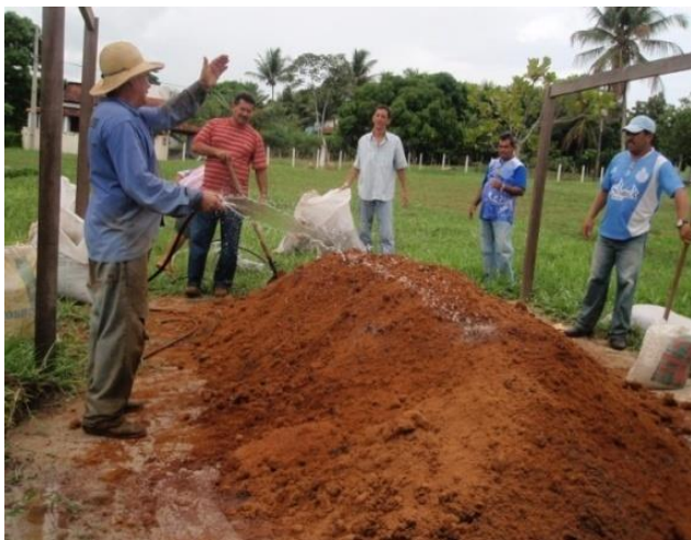
CONFEÇÃO DE SUBSTRATO ORGÂNICO