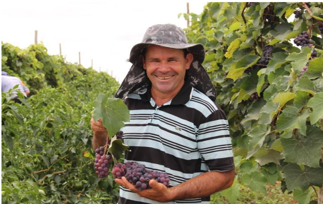
Produção de Uva no Perímetro Irrigado Califórnia